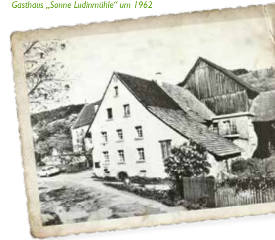
Gasthaus „Sonne Ludinmühle“ um 1962

sowie alle „Herzengewinner“, unsere Mitarbeiter der Ludinmühle