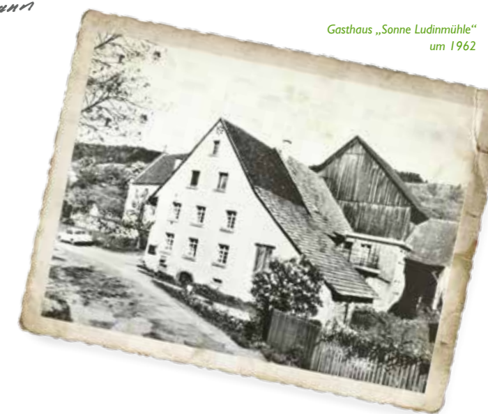
Gasthaus „Sonne Ludinmühle“ um 1962